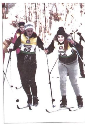
Лыжные трассы покорились не всем участникам

уверена в своих знаниях. Зачем же ей ГТО?