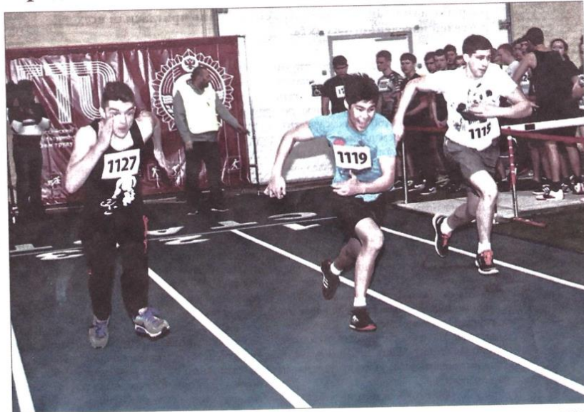
На беговой дорожке ребята выкладывались на 100 %